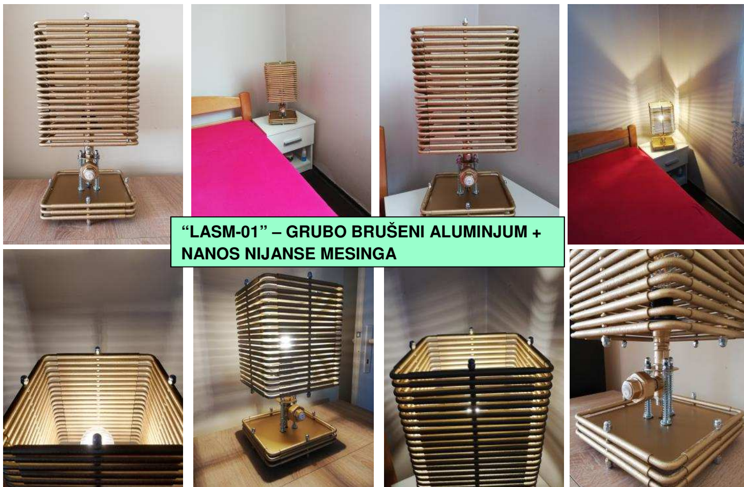
“LASM-01” – GRUBO BRUŠENI ALUMINIJUM + NANOS NIJANSE MESINGA