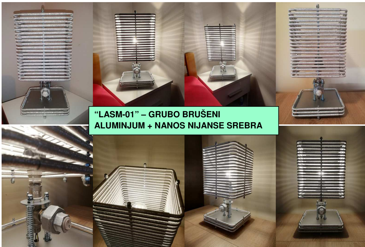
“LASM-01” – GRUBO BRUŠENI ALUMINJUM + NANOS NIJANSE SREBRA