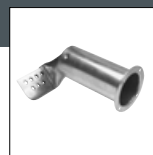
Item No. 1117 Dizna - duvalica 45 mm