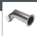
Item No. 1116 Dizna - duvalica 20 mm